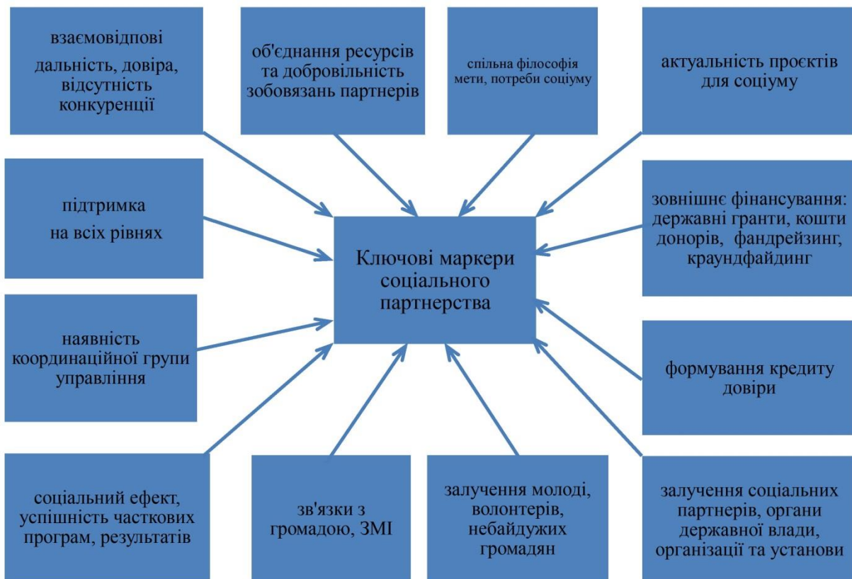
Рис. 2. Ключові маркери соціального партнерства

об'єднання. Серед партнерів – органи державної влади (районна/міська держадміністрація, ОТГ, сільська рада, міністерства, управління освітою тощо); батьківські комітети; заклади культури; бізнес-структури, та інколи іноземні партнери. У цьому зв'язку цінним для нашого дослідження стало оприлюднення незалежної доповіді до Ініціативи майбутнього освіти від колективної консультативної групи ЮНЕСКО з питань неурядових організацій з питань освіти 2030 (CCNGO), що відображає сучасні та майбутні світові тенденції та роль ОГС в освітній галузі.