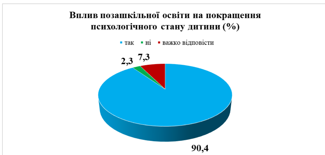
Рис. 5. Відповіді респондентів щодо впливу позашкільної освіти на покращення психологічного стану дитини