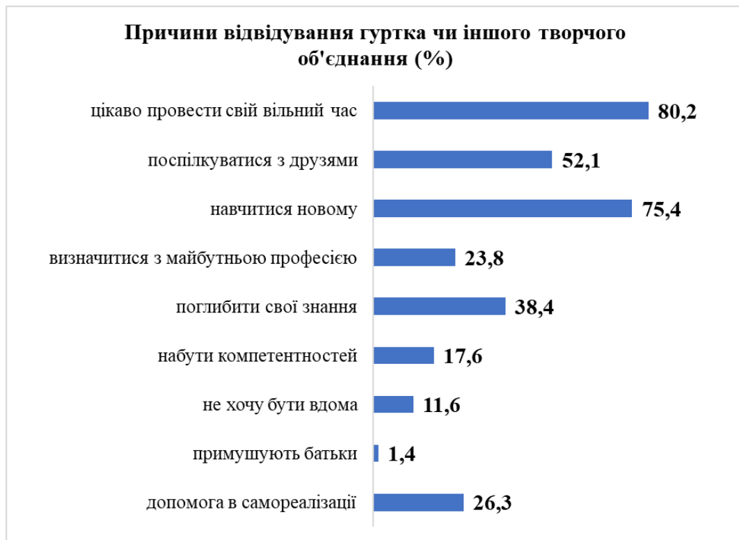
Рис. 2. Відповіді респондентів щодо причин відвідування гуртка чи іншого творчого об'єднання

Заклад позашкільної освіти створює умови для самоствердження особистості, набуття комунікативних компетенцій вихованців, навичок конструктивної взаємодії з однолітками в процесі спільної творчої діяльності. 88,7 % опитаним респондентам подобається колектив гуртка, у якому вони зараз навчаються; 69,1 % вихованців, учнів, слухачів планують і надалі продовжити навчання/обрати майбутню професію за напрямом роботи гуртка (Рис. 3).