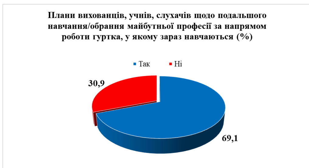
Рис. 3. Відповіді респондентів щодо подальшого навчання/обрання майбутньої професії за напрямом роботи гуртка, у якому вони зараз навчаються

Заклад позашкільної освіти створює умови для самоствердження особистості, набуття комунікативних компетенцій вихованців, навичок конструктивної взаємодії з однолітками в процесі спільної творчої діяльності. 88,7 % опитаним респондентам подобається колектив гуртка, у якому вони зараз навчаються; 69,1 % вихованців, учнів, слухачів планують і надалі продовжити навчання/обрати майбутню професію за напрямом роботи гуртка (Рис. 3).