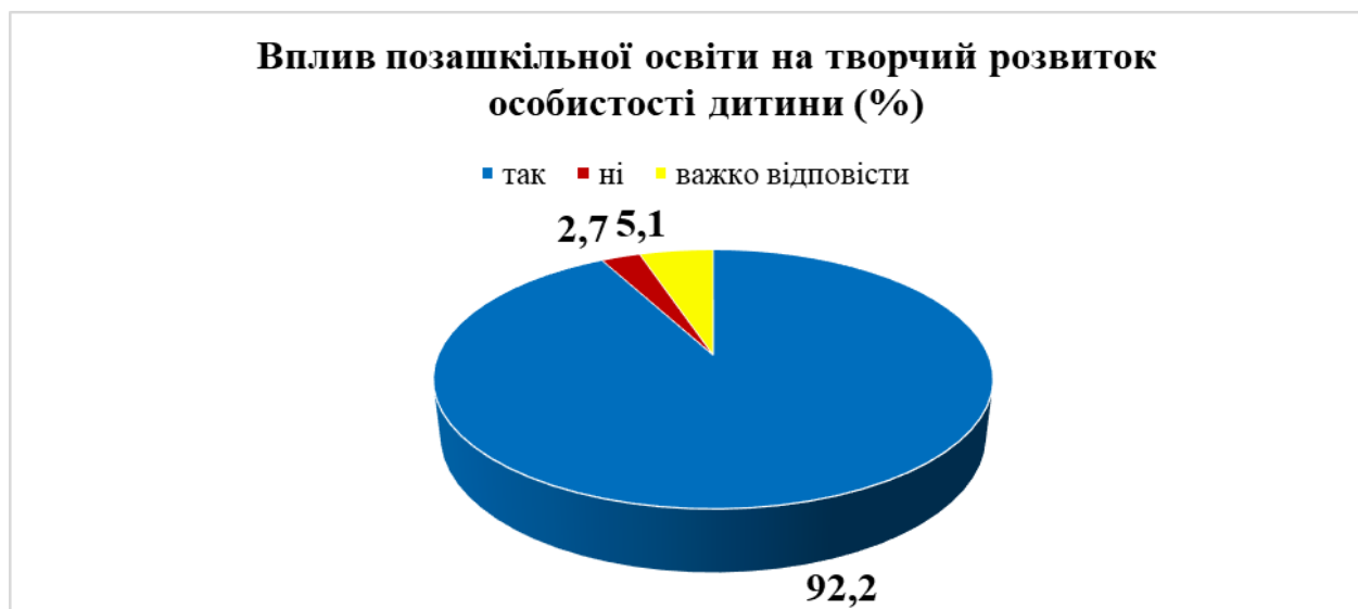
Рис. 4. Відповіді респондентів щодо впливу позашкільної освіти на творчий розвиток особистості дитини

У дослідженні також узяли участь батьки вихованців, учнів, слухачів закладів позашкільної освіти. Їхня кількість згідно з вибіркою складає 923 особи. На думку 92,2 % опитаних батьків, навчання в закладі позашкільної освіти сприяє творчому розвитку особистості дитини (Рис. 4.); 90,4 % переконані, що відвідування закладу позашкільної освіти сприяє покращенню психологічного стану дитини (Рис. 5). Також 93,6 % респондентів указали, що найголовнішим мотивом відвідування дитиною закладу позашкільної освіти є її власне бажання.