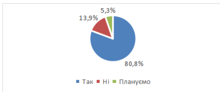
Рис. 3. Чи реалізуються Вашим закладом освітні проекти (акції, челенджі тощо), зокрема із залученням дітей ВПО?

Важливим аспектом роботи ЗПО є активна налаштованість на майбутнє, бачення шляхів залучення дітей, які постійно проживають в певній місцевості, так і дітей вимушених переселенців, до участі в різних напрямках позашкільної діяльності, які ними пропонуються. На запитання «Чи реалізуються Вашим закладом освітні проекти (акції, челенджі тощо), зокрема із залученням дітей ВПО?» «Так» відповіли 80,8 % респондентів, планують таку діяльність 13,9 % респондентів (рис. 3).