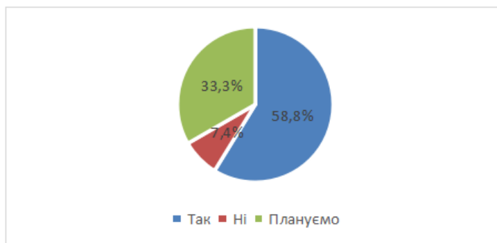
Рис 4. Чи приділяється увага у Вашому закладі розвитку інклюзивного освітнього середовища, зокрема із залученням дітей ВПО?

Зазначимо, що значна кількість осіб з особливими освітніми потребами була тимчасово переміщена до інших регіонів України. Окрім цього, в умовах війни збільшується частка дітей, що можуть мати тимчасові соціоадаптаційні, соціокультурні труднощі (пристосування до умов соціального середовища; інтеграції в соціальні групи тощо), що потребує додаткової уваги.